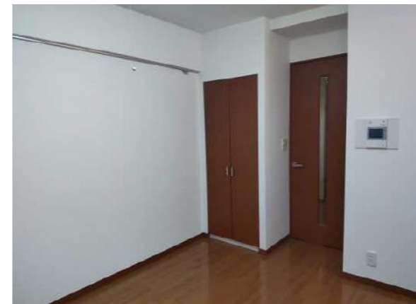
* 図面と現況が異なる場合は、現況優先とさせていただきます。