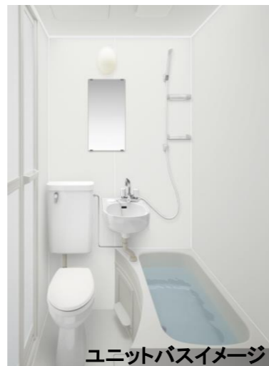
ユニットバスイメージ