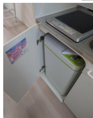
ビルトイン洗濯機&IHコンロ (お部屋により扉の向きが変わります)