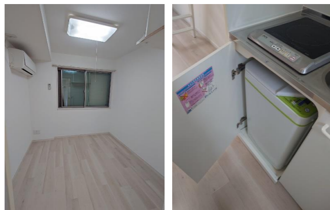
ビルトイン洗濯機&IHコンロ (お部屋により扉の向きが変わります)