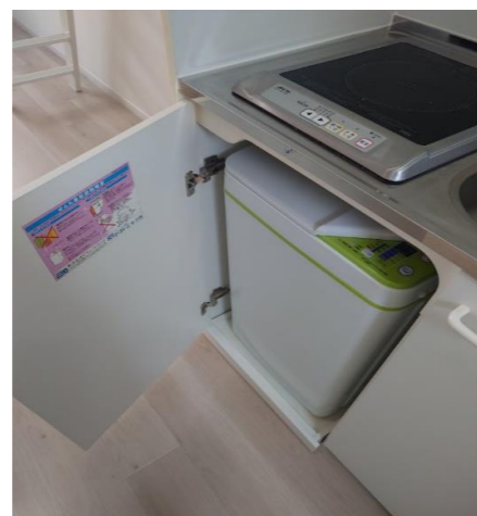
ビルトイン洗濯機&IHコンロ (お部屋により扉の向きが変わります)