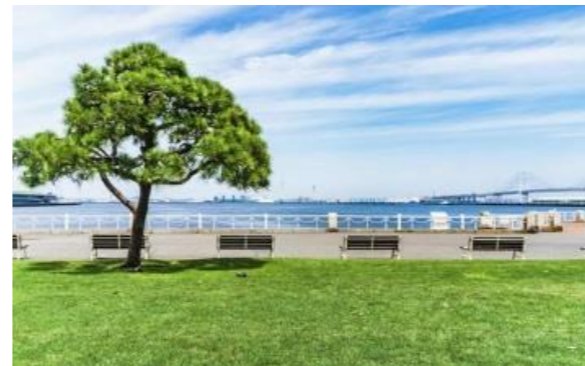
* 図面と現況が異なる場合は、現況優先とさせていただきます。