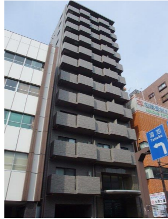
▲明治通りに面していないので静かです