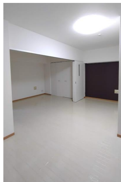
* 図面と現況が異なる場合は、現況優先とさせていただきます。