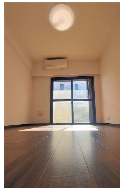
* 図面と現況が異なる場合は、現況優先とさせていただきます。