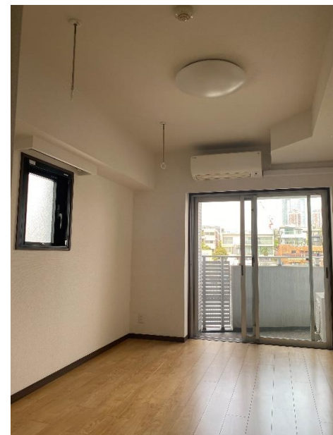
* 図面と現況が異なる場合は、現況優先とさせていただきます。